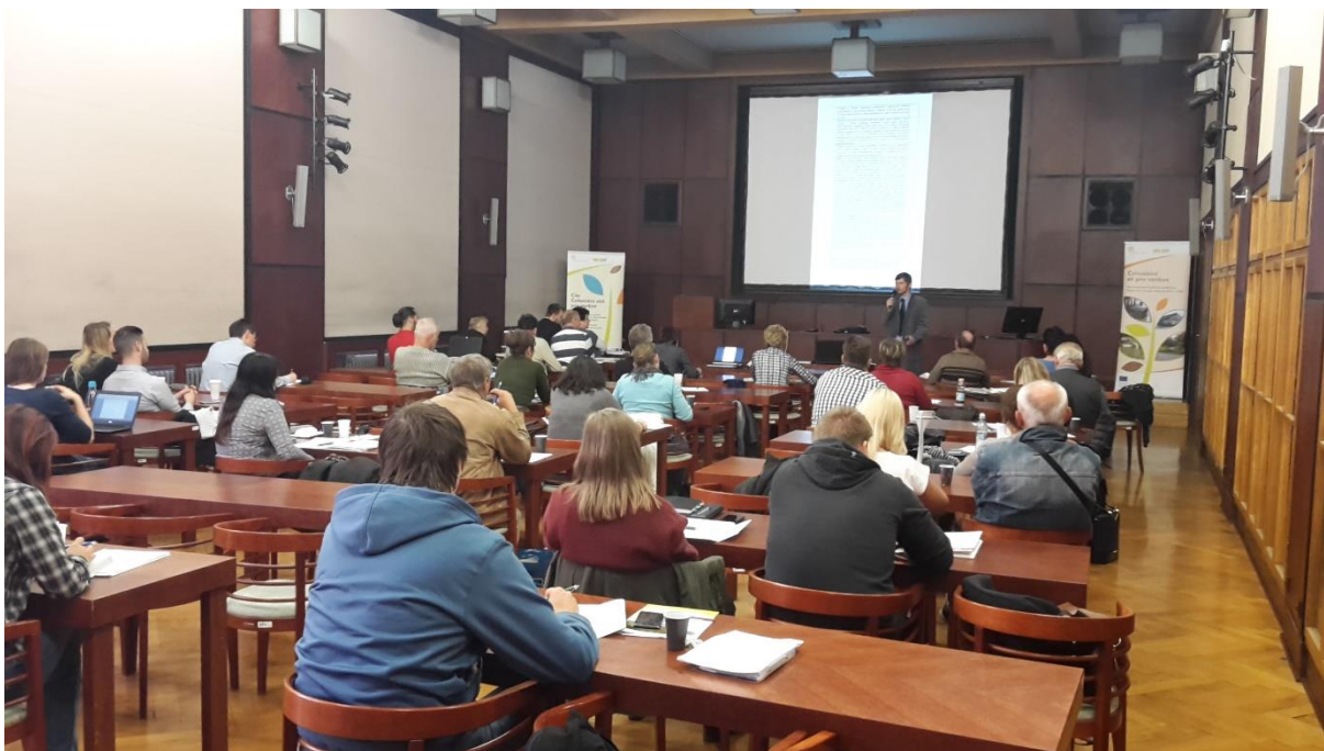
Seminář k PRV 5. kolo ve Slezské, Praha

V případě dotazů se žadatelé mohou obrátit na infolinku SZIF prostřednictvím telefonního čísla 222 871 871, nebo e-mailu: info@szif.cz .