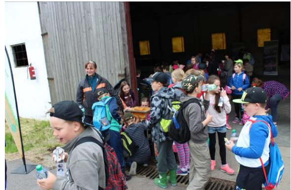
U dojení umělého vemene bylo neustále plno