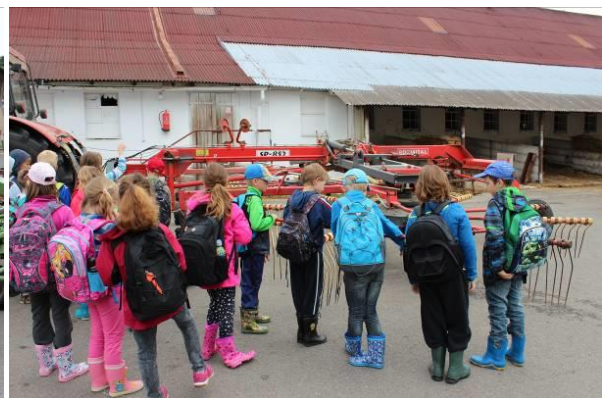
Prohlídka strojů s komentářem