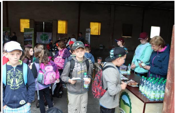
Ochutnávka Regionálních potravin. Propagační tiskoviny.