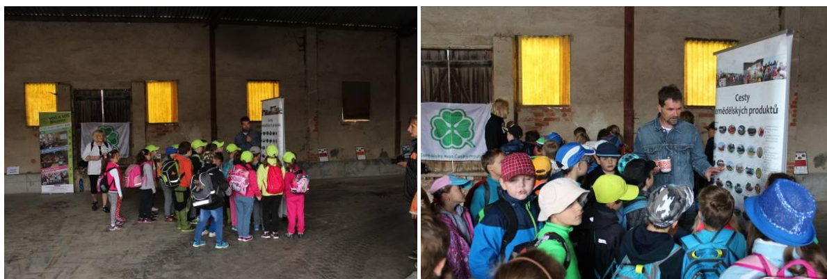
Cesta zemědělských produktů a u zdi naučná stezka