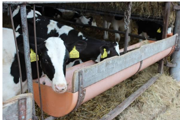
Telátka se dětem velice líbila