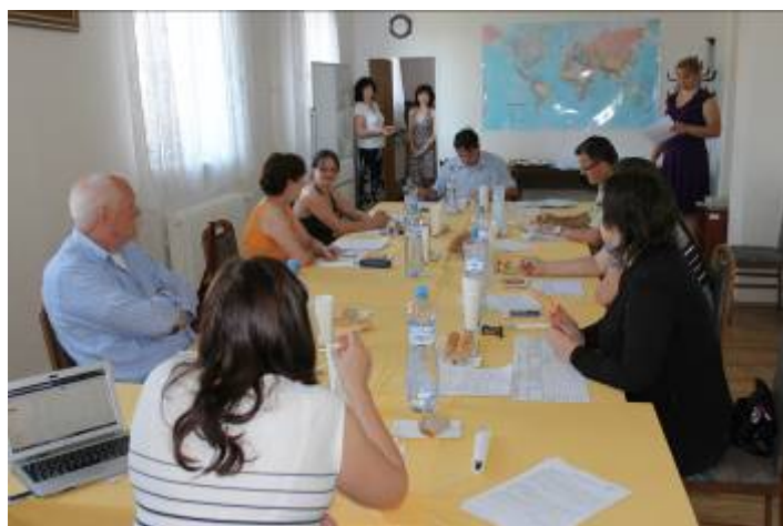
Zasedání hodnotitelské komise