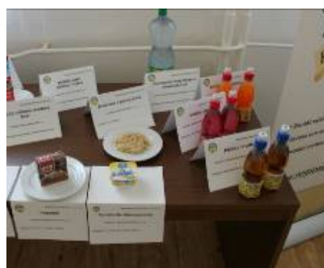
Výrobky dodané do soutěže