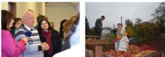
Moštovnu Lažany jsme zastihli na konci hlavní sezóny.

Na konci října jsme se vyjeli s novináři podívat za oceněnými výrobci do Libereckého kraje. Dvě desítky novinářů měly možnost vidět výrobu v Moštovně Lažany a Kozí farmě Pěnčín na vlastní oči. Bezprostřední zkušenost z výroby a možnost diskuze s producenty jsou nejlepším způsobem, jak je přesvědčit o kvalitě a jedinečnosti výrobků s puncem Regionální potraviny.