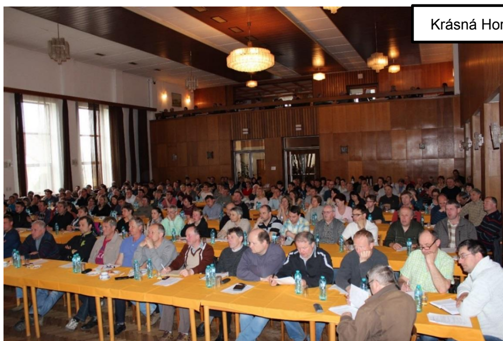
Krásná Hora 12. 4. 2016

Prezentace z proběhlých školení naleznete ZDE .