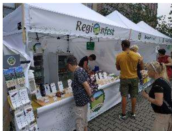
Stánek s ochutnávkou v Národním zemědělském muzeu