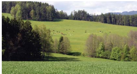
Správně organizovaná pastva s nízkou koncentrací hospodářských zvířat na travních porostech nenarušených orbou.