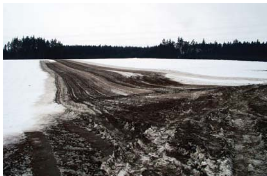
nesprávné hnojení na půdu pokrytou vrstvou sněhu

Splnění požadavku se zjišťuje kontrolou v terénu. Při podezření na porušení probíhá kontrola dat aplikace hnojiv dle evidence o hnojivech použitých na zemědělskou půdu, knihy jízd, popř. výkazů práce, s využitím záznamů nejbližších hydrometeorologických stanic.