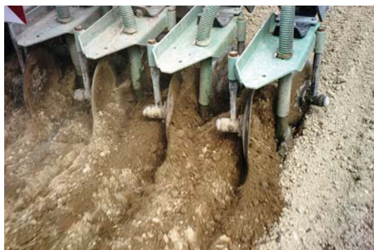
Správné zapravení: kejda vytéká z hadic aplikátoru do brázd, které se ihned zaklopí.