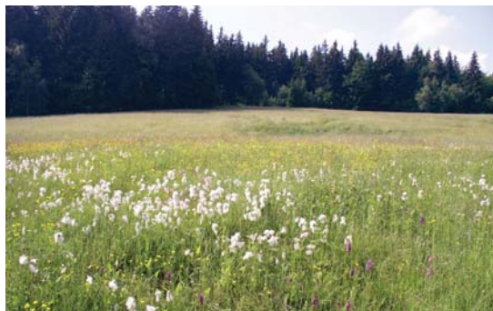
Cenným typem stanoviště je např. podmáčená druhově bohatá louka.

Hodnocení: Rozsah i závažnost zjištěného porušení jsou velké, neboť došlo k pravděpodobnému zničení předmětu ochrany. Porušení je trvalé. Inspektor zároveň nahlásí porušení (rozorání) příslušné kontrolní organizaci.