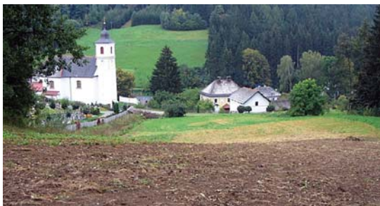
Rozorání svahu znamená riziko splavení půdy do vsi.

cí plodina už sklizena. Travní porost je evidován v LPIS buď jako travní porost – stálá pastvina 5 nebo jako ostatní travní porosty. Rozorání je považováno za závažnější, pokud je rozorána stálá pastvina, dále pokud k němu dojde na pozemcích se sklonitostí nad 7° nebo pozemek obsahuje hlavní půdní jednotky (HPJ, vyjádřené druhou a třetí číslicí kódu BPEJ) s vysokou vsakovací schopností. 6 Rozoraným pozemkem se rozumí skutečně rozoraná plocha na půdním bloku nebo jeho dílu.