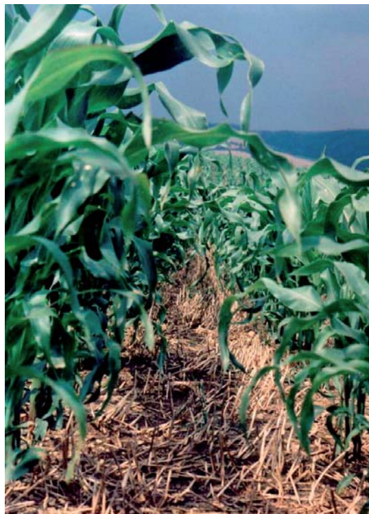
kukuřice pěstovaná půdoochrannou technologií (setá do mulče) na svahu