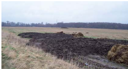
příklad nadměrné aplikace kalu