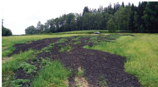
nadměrná dávka kalu (nedodržení maximální dávky sušiny na 1 ha)