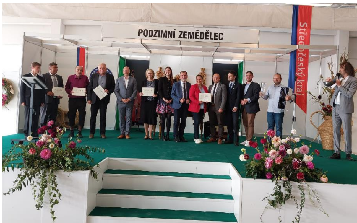
Ocenění zemědělských podnikatelů